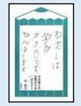
『やる気とか元気がでるえんぴつポスター』 金益見 著 一般 376 文藝春秋