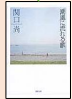
『潮風に流れる歌』 関口尚 著 B 913.6/セキ 徳間書店