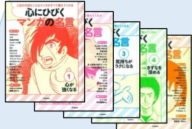
『心にひびくマンガの名言』①～⑤巻 K/15 学研教育出版