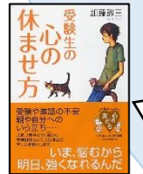
『受験生の心の休ませ方』 加藤諱三 著 K/15 PHP 研究所

今悩むから、明日強くなる。悩まないで強くなることはない。春はもうすぐそこ。頑張ってください!