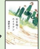
『石を抱くエイリアン』 濱野京子 著 K913/ハマノ 偕成社

阪神淡路大震災がおこった 1995 年に生まれた主人公たちは、中学卒業時に東日本大震災に遭遇した。友を亡くし普通の毎日があたりまえでなくなった時、新たな希望を持つことができるのか・・・同世代の君に読んでほしい、考えさせられる作品です。