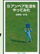
『5 アンペア生活をやってみた』 斎藤健一郎 著 K/90 岩波書店

エネルギー問題は他人事ではなく、自分のできることはなんだろうと常に考えていきたいですね。