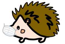
ハリネズミのウニー